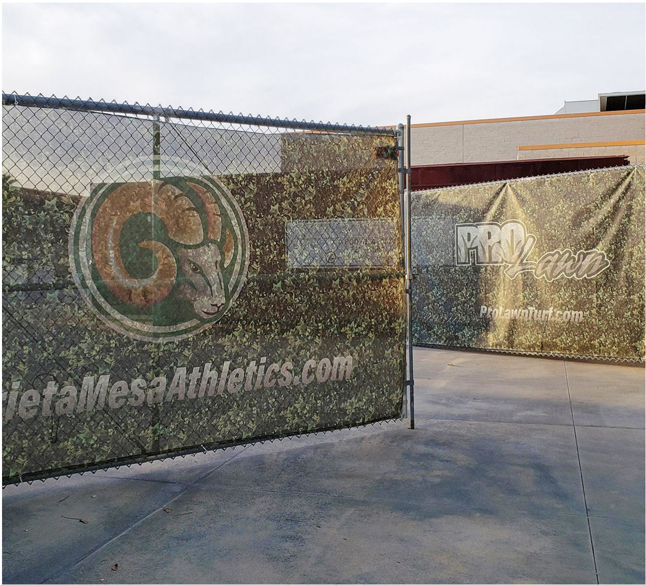
مشاهده نمونه های چاپ برشور و تراکت