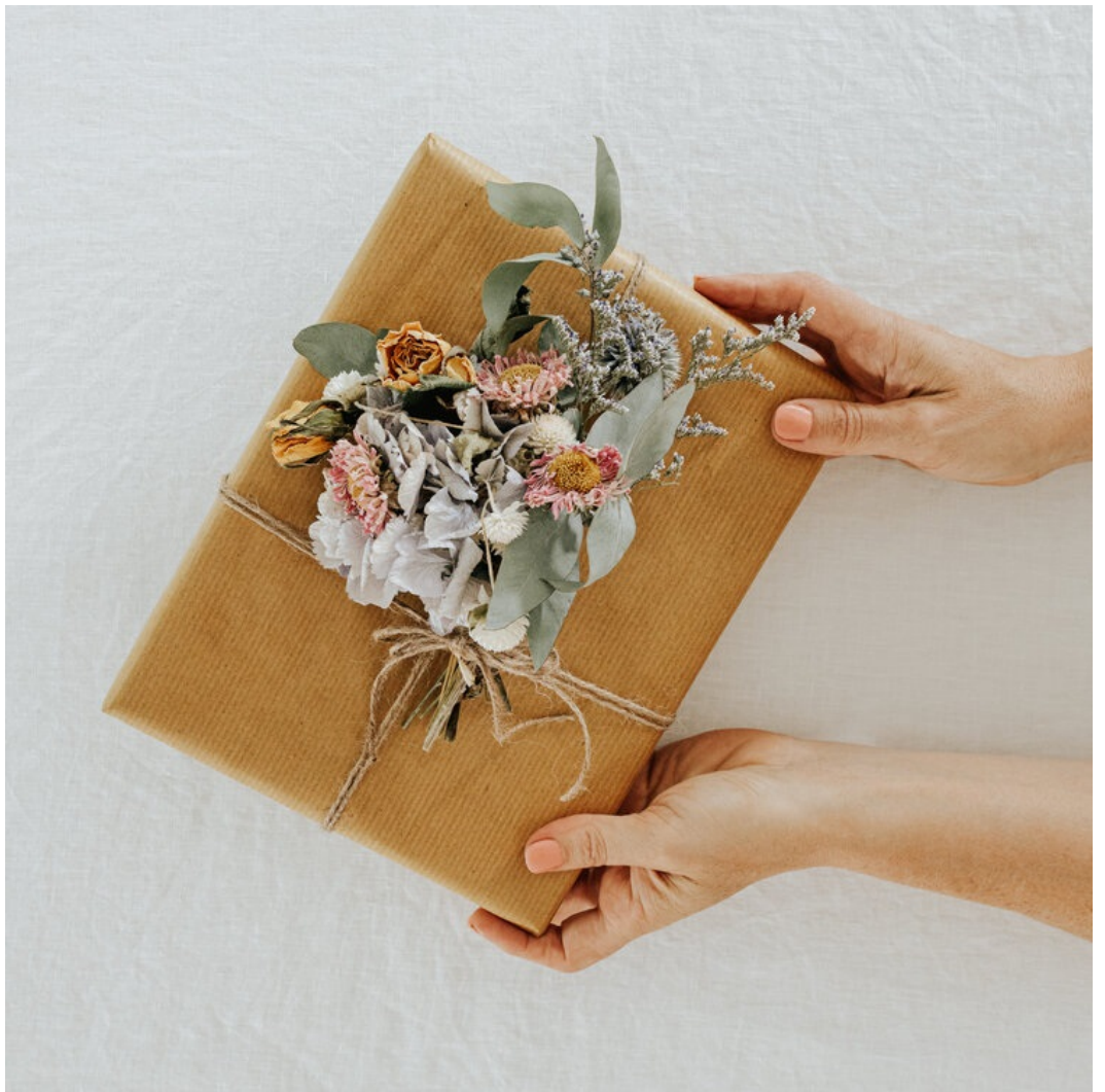
روش دوم برای تزئین کاغذ کادو کرافت