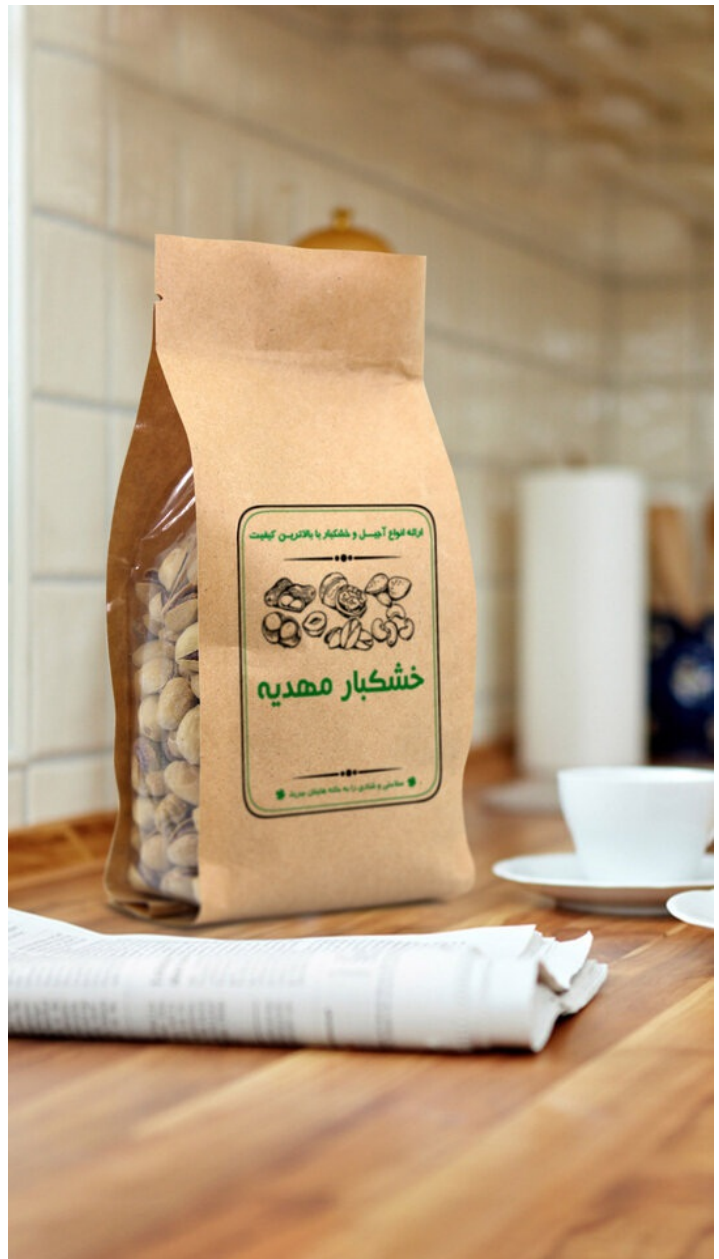
مشاهده و خرید آنلاین پاکت پاکس بوچ