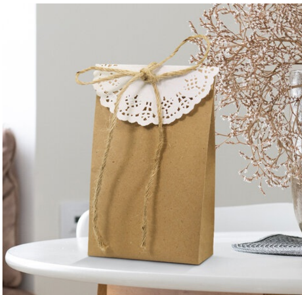
مشاهده و خرید آنلاین پاکت کرافت

شرکت پاکت سازی تورنگ، تولید پاکت بسته بندی را در شکل ها و سایزهای مختلف جهت فروش عمده و جهت استفاده برای کسب و کارهایی که برای محصولات خود به پاکت احتیاج دارند به بهترین شکل انجام و در اختیار مشتریان عزیز قرار می‌دهد.