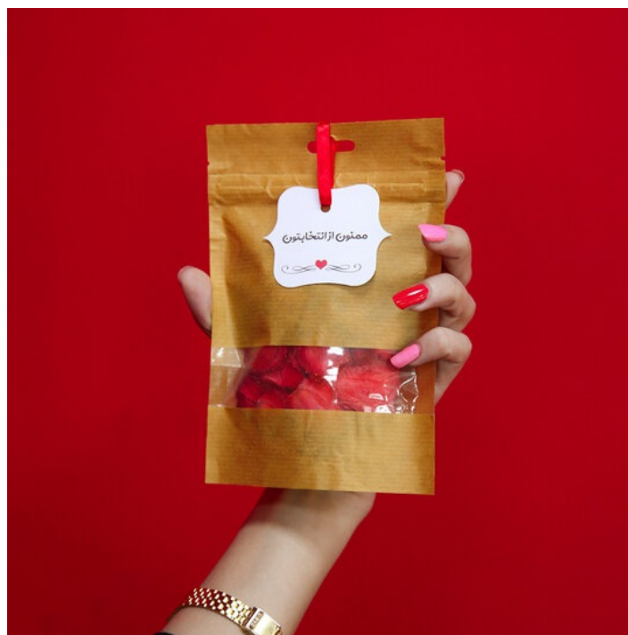
مشاهده و خرید آنلاین پاکت زیپ دار پنجره دار

ما با استفاده از تولید پاکت‌های حرفه‌ای و جذاب، به بازاریابی کسب‌وکار شما کمک می‌کنیم. شرکت پاکت سازی تورنگ، به تولید پاکت در اندازه‌ها و اشکال مختلف، جهت بسته‌بندی می‌پردازد و به شما کمک می‌کند تا پاکت‌هایی را که مناسب کسب‌وکار شماست به راحتی انتخاب کنید و با طراحی منحصر به فرد ارائه دهید. می‌توانید اگر ایده‌ای در ذهن خود دارید با ما در میان بگذارید و از مشاوره‌های ما بهره‌مند شوید.