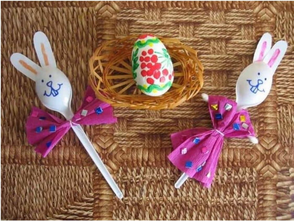
خريد قاشق بكار مصرف