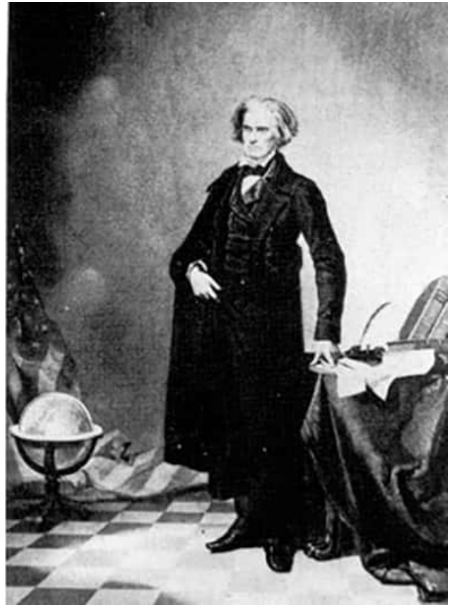
عکس لینکلن (چپ) ترکیبی از صورت او با بدن جان کالون (راست) است

شاید یکی از نخستین کسانی که از دستکاری عکس برای بهتر جلوه دادن تصویر خود استفاده کرده، آبراهام لینکلن، رئیس‌جمهوری آمریکا در قرن نوزدهم باشد. یکی از مشهورترین پرتره‌های او در واقع ترکیبی از صورت او با بدن سیاستمداری به نام جان کالون است.