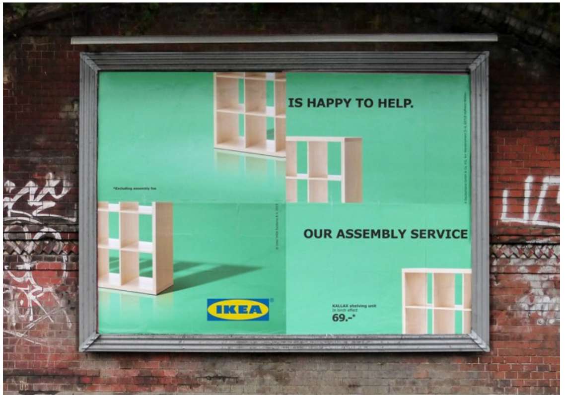
سفرش شاپینگ بگ و ساک تبلیغاتی