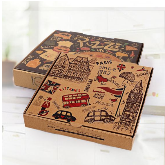
مشاهده و خرید آنلاین انواع جعبه سبب زمینی