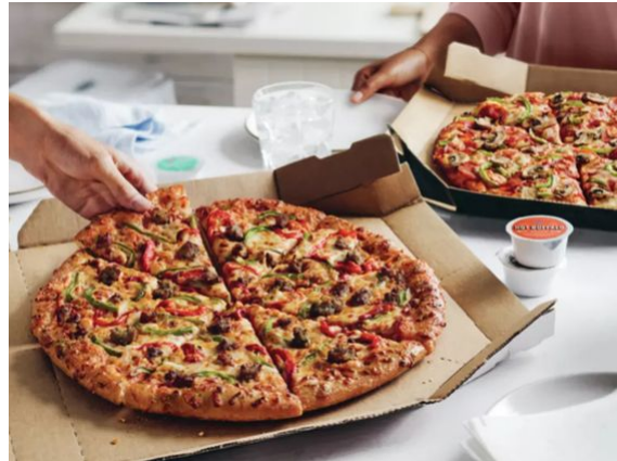
خرید نی نوشابه

نوع طراحی بسته بندی فست فود به‌خصوص بسته بندی پیتزا در جذب مشتری و تبدیل آن به مشتری دائمی بسیار موثر است. از آنجا که پیتزا یک غذای بسیار جذاب در فست فودی ها و کافه ها و رستوران است ما جعبه پیتزا را مثال زدیم می‌توانید انواع بسته بندی های دیگر مانند پاکت پیتزا، پاکت فست فود، لیوان سبب زمینی، سیگنال پیتزا، ساک دستی کاغذی جهت حمل فست فود و کاغذ ساندویچ و سایر بسته بندی های فست فود را شخصی سازی کنید و موجب جذب مشتری بیشتر شوید.