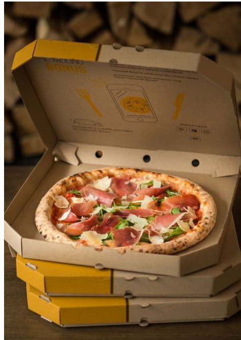
مشاهده و خرید آنلاین انواع پاکت پیتزا

سعی کنید با کمی خلاقیت در طراحی جعبه پیتزا از هزینه‌ها کم کنید. با گذاشتن یک برگه تخفیف یا گذاشتن کوپن‌هایی که با جمع کردن تعداد خاصی از آن‌ها می‌توان یک پیتزای مجانی برنده شد مطمئن شوید که مشتری حتماً به پیتزا فروشی یا رستوران شما برمی‌گردد. بعضی از مشتری‌ها ممکن است منوی شما را کامل بلد نباشند برای همین بهتر است با هر جعبه سفارشی پیتزا یک منو هم بفرستید تا با رستوران شما آشنا شوند.